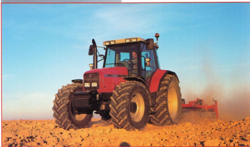
PCS (Power Control System) gör MF 6200 till två traktorer i en: en smidig och stark lastartraktor, eller som här, en kraftfull dragare i fält.

MF 6200 från 75 till 135 hk ger dig råstarka, miljövänliga motorer, tillsammans med marknadens förnämsta transmission. Dynashift PLUS har fyra kopplingsfria växelsteg på var och en av de åtta huvudväxlarna, kopplingsfri fram/back och fingertoppsmanövrerad koppling. Allt samlat i ett reglage: PCS (Power Control System), bekvämt placerat till vänster vid ratten. Lägg sedan till smarta automatiska TC (Transmission Controller) – som bland annat sköter i- och urkoppling av fyrhjulsdriften och differentialspärrens, samt övervakar och skyddar skyddar transmissionen mot överbelastning – och du har marknadens bästa och bekvämaste all-round-traktor. ■