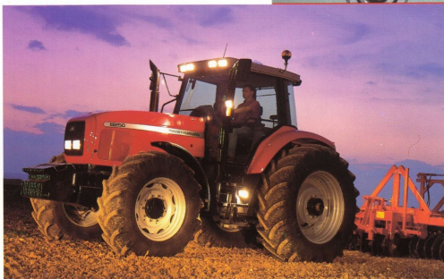
MF 8250 – en lysande stordragare.