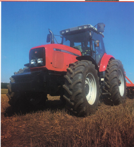
MF 8250 – 185 hk med Powershift Plus.

MF 8200 med lyftkapacitet upp till 10 ton har bakaxlar dimensionerade därefter: hela nio planetdrev i slutväxlarna och dubbla oljekylade skivbromsar på varje sida. Konstruktionen är uppbyggd i fem moduler för respektive parkeringsbroms och eventuell krypväxelenhet, differential, slutväxlar med bromsar, och krafttuggsdrivningen. Allt i allt är dimensionerat med stora säkerhetsmarginaler, för överföring av hög effekt och stora moment med fullständig pålitlighet. ■