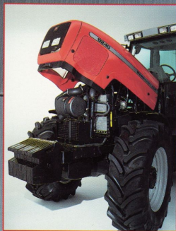
MF 8240: 170 hk starka motor friläggs i ett handgrepp: tryck i låsknappen och låt huvan stiga mot skyn.

Mellan 145 och 260 hk finner du de stödigaste traktorerna från MF. Hela serien hämtar sin kraft ur den modernaste motorteknik som är tillgänglig idag, med cylindervolymer upp till överväldigande 8,4 liter. Den senaste generationens avancerade Powershift-växellådor ger dig 18 kopplingsfria steg med unik mjuk växling, och ett tätstegat register i fältarbetsområdet upp till 16 km/h med endast 13 % stegring på de tio mest använda växlarna. Det unika PCS-reglaget (Power Control System) bekvämt placerat till vänster vid rattens, ger förutom kopplingsfri fram/back och fingertoppsmanövrerad koppling, fullständig kontroll över växellådan. Höger hand är då hela tiden fri att manövrera hydraulik och trepunktslyft, som integrats lätt tillgänglig i höger armstöd. ■