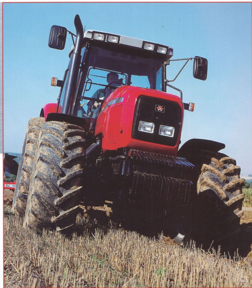
MF 8200 – en stordragare med det rätta greppet i fälorna.

D e nya MF 6200 och 8200 är traktorer utan kompromisser. Konstruerade med en mängd nya fördelar plus oöverträffad kontrollerbar kraft från 75 till hela 260 hk. Våra nya avancerade lågemissionsmotorer levererar enastående vridmoment och kraftreserv genom hela modellregistret.